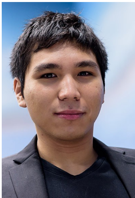
GM Wesley So, USA