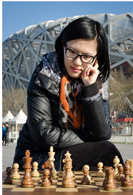
Weltmeisterin GM Hou Yifan, China

Nach Beendigung der aktiven Laufbahn von Ungarn's Judith Polgar ist die derzeitige Weltmeisterin GM Hou Yifan unbestritten die weibliche Nummer 1 in der Welt. Sie hat ihren WM-Titel bereits mehrfach mit großer Überlegenheit verteidigt bzw. zurückgeholt. Von der FIDE wurde ihr schon in zwei Fällen der WM-Titel am „Grünen Tisch“ aberkannt, weil sie sich weigerte, bei der alle zwei Jahre ausgetragenen FIDE - K.O.-WM anzutreten, die bei den Männern bereits längst wieder passe' ist. Ihre Forderung, auch bei den Frauen wieder zum zweijährigen WM-Zweikampf überzugehen, wurde bisher von der FIDE mit fadenscheiniger Begründung abgelehnt. Sie ist konsequent geblieben und aus dem Grand-Prix-Wettbewerb ausgestiegen.