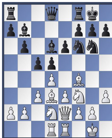
Stellung nach 12. Tad1 Se7g6

13. Lxg6 hxg6 14. Lxd6 Dxd6 15. Se5 g5 16. f4 gxf4 17. Tf1 Sd7 18. Dh5 Sd7f6