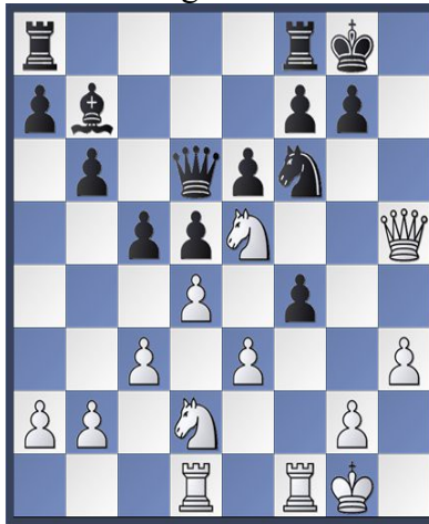
Stellung nach 18. De2h5 Sd7f6