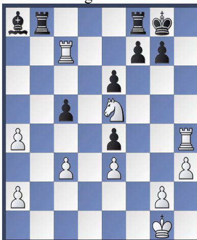
Stellung nach 27. b3xa4 Lb7a8